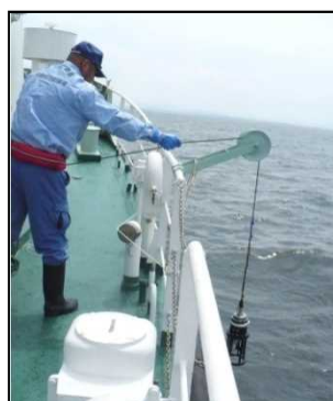
湾内6箇所にて水質調査を実施