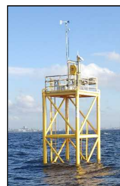
設置されたモニタリングポスト(検見川沖)