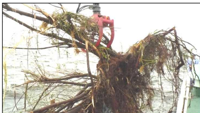
清掃兼油回収船「べいくりん」による浮遊ゴミの回収作業