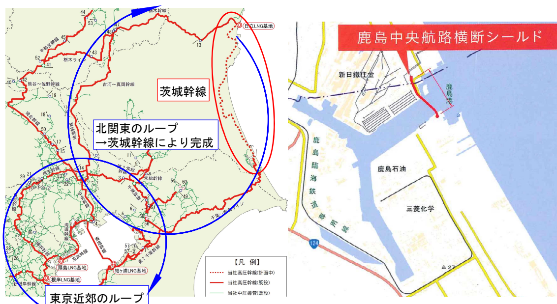
図 (左)東京ガス高圧幹線網(東京ガス web ページより一部加工) (右)鹿島港中央航路横断シールド敷設位置

茨城幹線は、そのほとんどが既存の道路等を一度掘り起こして配管を埋設する「開削工法」により建設されますが、交通量が多く掘り起こしが難しい道路や、河川や航路を横断する必要がある地点では、地中を水平方向に掘りながらトンネルを構築する「シールド工法」が用いられています。今回は茨城幹線の工事の一つである、「鹿島中央航路横断シールド工事」を見学させていただきました。