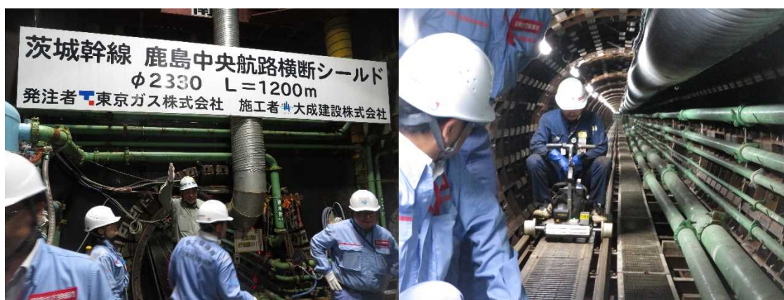
図 (左)発進立坑のシールド出発地点 (右)坑内を移動する専用の台車

その他にも、万が一事故が発生した際にトンネル坑内にいる全員を安全に誘導し、脱出を即座に確認するためのICタグによる自動入出管理や、津波が発生した際に坑内への水の浸入を防ぐ仮囲いなど、様々なリスクを事前に想定した対策が取られていました。