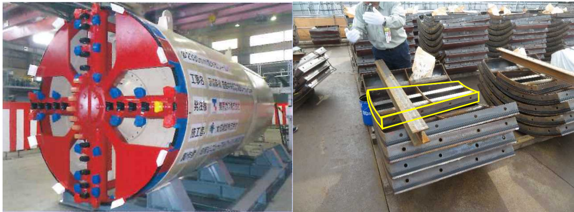
図 (左)茨城幹線に用いられるシールドマシン (右)セグメント 黄枠がくさび形の Kセグメント