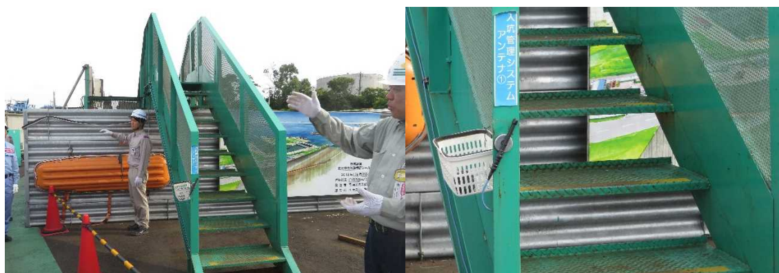
図 (左)津波防護のための仮囲い (右)坑内入出管理のためのアンテナ