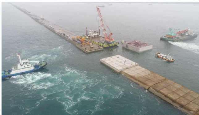
ケーソン据付状況