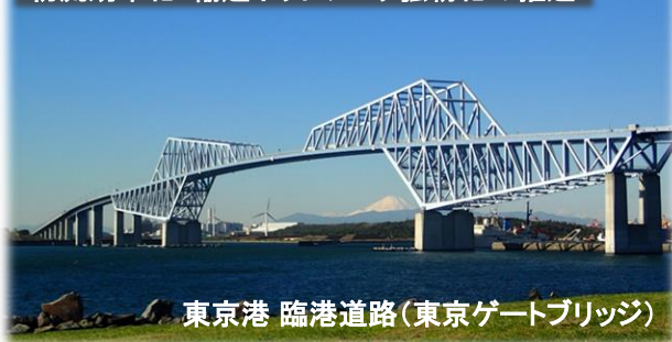
東京港 臨港道路(東京ゲートブリッジ)