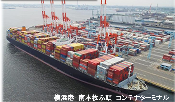
横浜港 南本牧ふ頭 コンテナターミナル