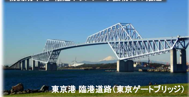
東京港 臨港道路(東京ゲートブリッジ)