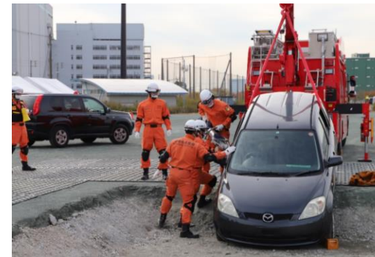
人命救助訓練 (川崎市・神奈川県警)