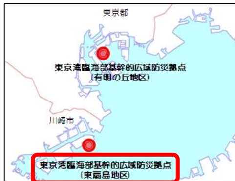
東扇島基幹的広域防災拠点位置図