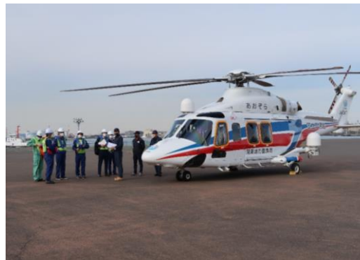
非常参集訓練 (関東地方整備局・関東運輸局・川崎市・埋浚協会)