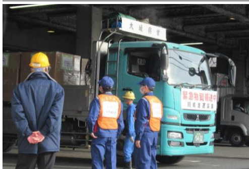
緊急支援物資一時保管訓練 (神奈川倉庫協会)