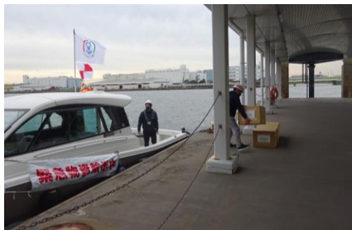
緊急支援物資荷海上輸送訓練 (マリーナ・ビーチ協会)