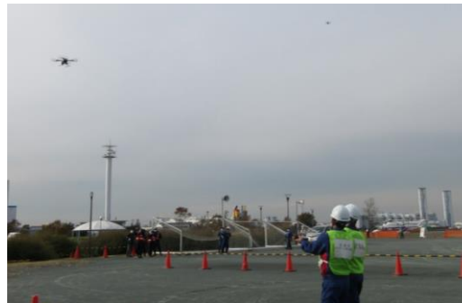
被災状況調査訓練 (関東地方整備局・海洋調査協会)