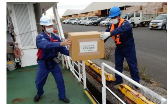
緊急支援物資荷海上輸送訓練 (関東地方整備局)