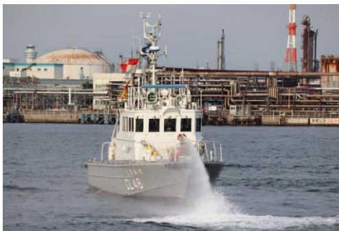
航路啓開訓練 (関東地方整備局・海上保安部)