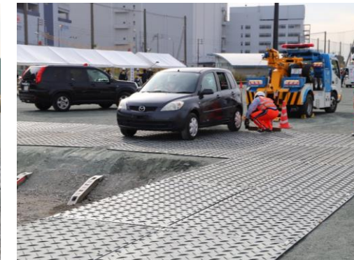
輸送路啓開訓練 (日本自動車連盟・神奈川県警)