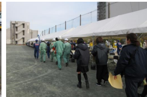
津波避難・帰宅困難者輸送訓練 (関東地方整備局・川崎市)