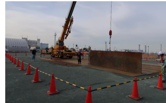
防災拠点等応急復旧訓練 (埋浚協会・日立建機日本)