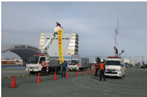
ライフライン応急復旧訓練 (東京電力パワーグリッド・KDDI)