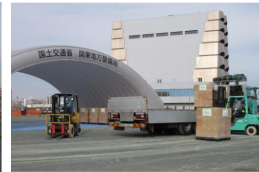
緊急支援物資荷さばき訓練 (川崎港運協会)