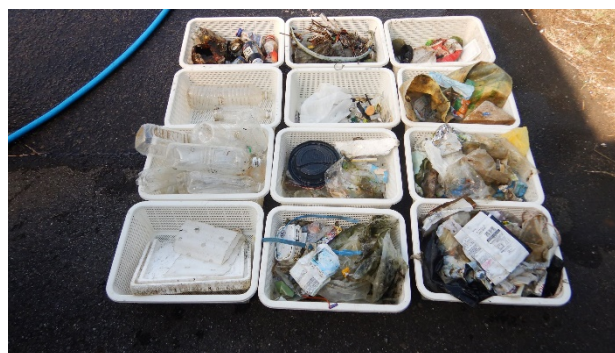
分別中の回収ゴミ