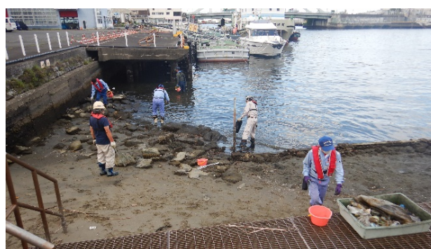
「潮彩の渚」のゴミ拾い-2