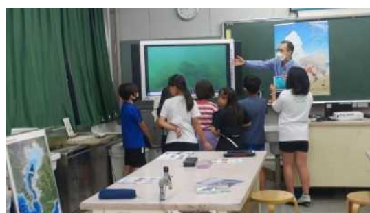
身近な海中の映像放映