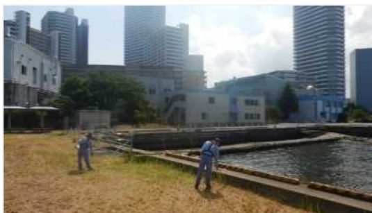
護岸上でのゴミ拾い状況