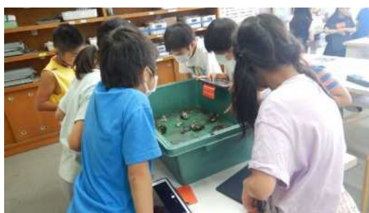
タッチプールへの関心

実施日 : 令和 5 年 7 月 5 日 (水) 横浜市立篠原小学校 令和 5 年 7 月 12 日 (水) 横浜市立幸ヶ谷小学校 令和 5 年 7 月 13 日 (木) 横浜市立幸ヶ谷小学校