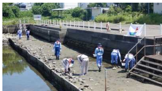
「潮彩の渚」でのゴミ拾い状況